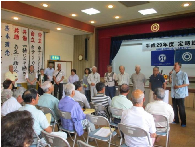
挨拶をする新役員の皆さん